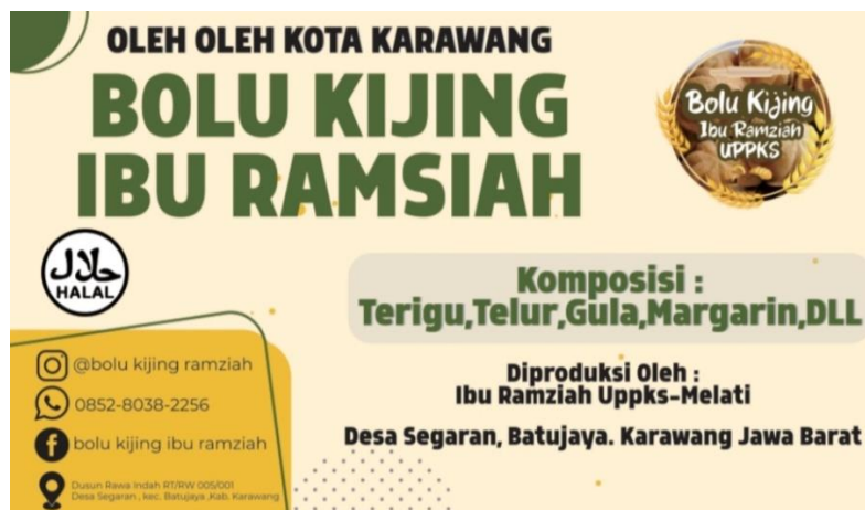
Gambar 3. 1 Flayer Bolu Kijing