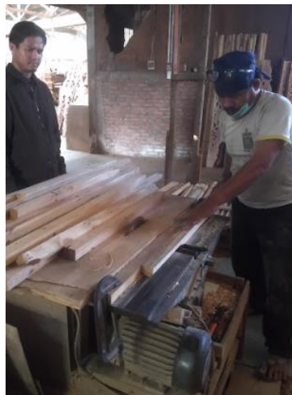
Gambar 5. Proses pemtongan

Jenis kayu tersebut memiliki struktur yang kuat namun mudah didapati dengan harga yang relative masih terjangkau. Dengan kayu tersebut maka digunakan untuk pembuatan dan pelatihan mebel. Proses pelatihan mebel dimulai dengan proses memotong. Proses pemotongan dapat dilihat pada gambar 5.