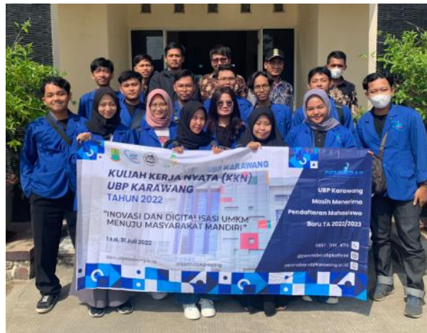
Gambar 2. Sosialisasi pentingnya peningkatan skill di dunia kerja

Setelah memberikan arahan tersebut maka masyarakat diarahkan untuk membentuk kelompok kerja dan diarahkan untuk jenis kayu dan perlakuan pada mebel tersebut. Pada gambar 3 merupakan masyarakat desa untuk mengikuti pelatihan tersebut.