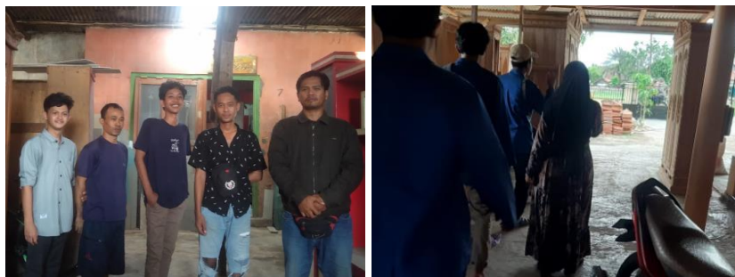
Gambar 3 Pemuda yang mengikuti pelatihan

Setelah memberikan arahan tersebut maka masyarakat diarahkan untuk membentuk kelompok kerja dan diarahkan untuk jenis kayu dan perlakuan pada mebel tersebut. Pada gambar 3 merupakan masyarakat desa untuk mengikuti pelatihan tersebut.