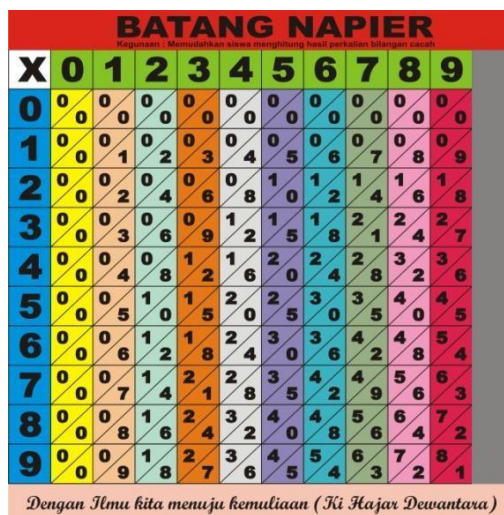
Gambar 1 Media Pembelajaran BatangNapier

kelompok produk dengan angka 0, peluru ke-3 adalah kelompok produk dengan angka 1, poin ke-4 adalah kelompok produk dengan angka 2, dan seterusnya. produk dengan nomor bagian au 9. . Jadi ada 11 bagian. (Sumardiyono dkk., 2011). Berikut ini adalah batang napier yang digunakan dalam kegiatan pengabdian :