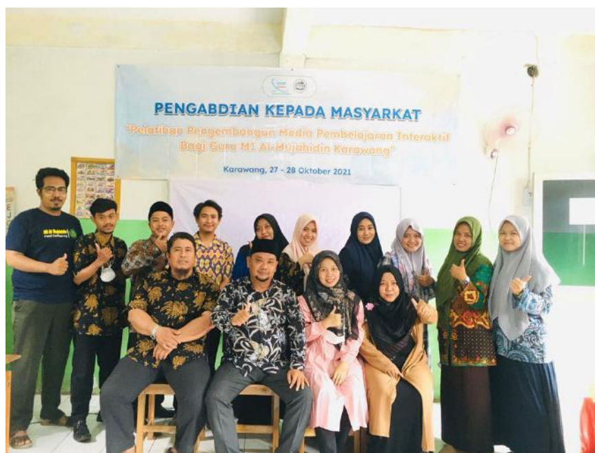
Gambar 1. Tim Pelaksana dan Peserta Pengabdian Kepada Masyarakat

Pelatihan pengembangan media pembelajaran interaktif bagi Guru MI Al-Mujahidin dengan menggunakan Microsoft PowerPoint dilaksanakan pada tanggal 26-27 Oktober 2021 yang berlangsung pukul 08.00-13.00. Pelatihan pengembangan dilaksanakan selama sepuluh jam, sesuai waktu yang ditargetkan. Pelaksanaan kegiatan terdiri dari tiga orang dosen yang dibantu oleh tiga orang mahasiswa sebagai instruktur pelatihan.