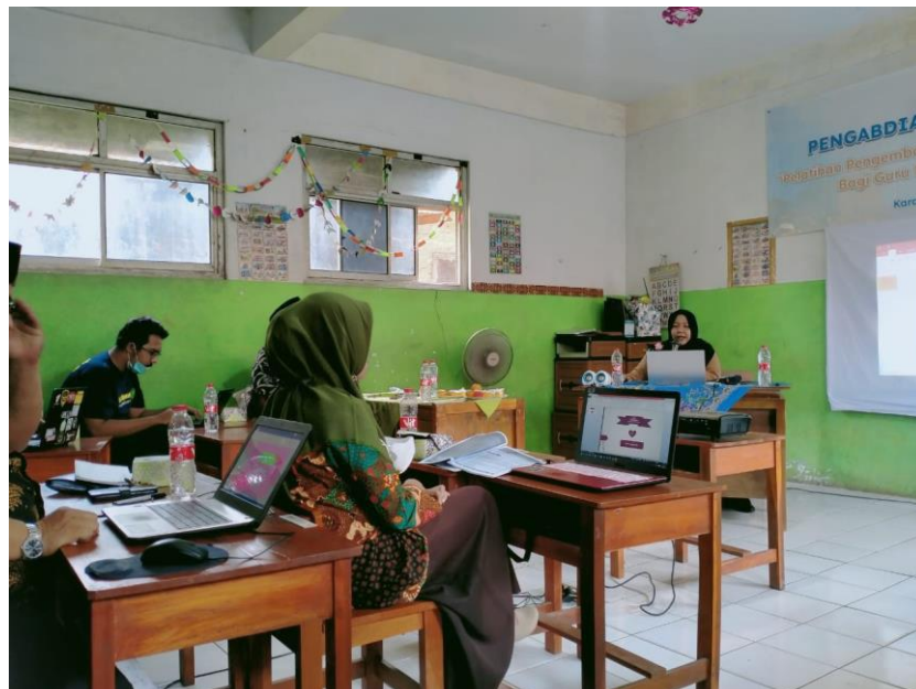
Gambar 3. Kegiatan Pengabdian Kepada Masyarakat

Setelah materi pelatihan selesai, pada hari terakhir disediakan waktu kurang lebih 120 menit untuk para peserta mengerjakan latihan guna menguji pemahaman materi secara keseluruhan. Adapun setiap peserta diminta membuat bahan ajar sesuai dengan bidang yang diampunya masing-masing. Dari keseluruhan hasil yang dikumpulkan didapatkan rata-rata pemahaman peserta pada materi adalah 90% (dilihat dari hasil latihan .ppt yang dibuat). Salah satu contoh hasil pembuatan bahan ajar dapat dilihat pada Gambar 4 & 5.