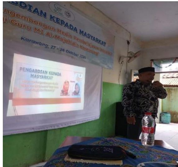
Gambar 2. Pembukaan Kegiatan Pengabdian Kepada Masyarakat