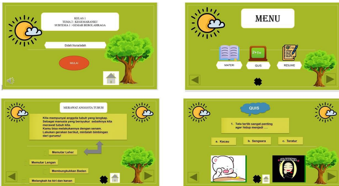
Gambar 4. Contoh Hasil Latihan Peserta