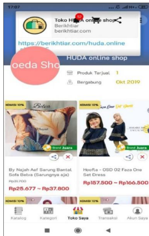
Gambar. Aplikasi Evermouse