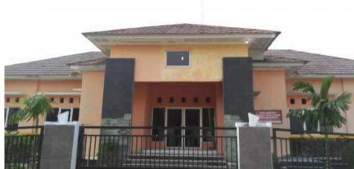
Gambar 2 Kantor Desa Sukamakmur, Kecamatan Teluk Jambe Timur, Kabupaten Karawang

Desa Sukamakmur juga memiliki Usaha Kecil dan Menengah (UKM) berupa makanan ringan terbuat dari tepung ketan yang diberi nama Opak Kawung Sukamakmur berdiri sejak 2010 dibawah pimpinan Bapak Ade, berdasarkan informasi Bapak Sutarman selaku Kepala Desa Sukamakmur bahwa penjualan Opak Kawung sebagian besar diproduksi untuk dipasarkan ke toko oleh-oleh Karawang namun saat ini diproduksi jika ada pemesanan dan acara di Kecamatan oleh karena itu untuk mengembangkan pemasaran Opak Kawung dapat dipasarkan secara online melalui e-commerce dengan tujuan dapat memperluas pemasaran dan meningkatkan perekonomian di Desa Sukamakmur.