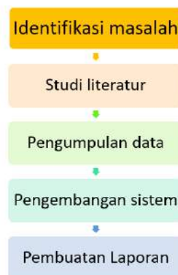
Gambar 3. Kerangka Kerja Penelitian

Untuk membantu dalam pelaksanaan penelitian ini, maka perlu adanya prosedur penelitian dalam bentuk kerangka kerja yang jelas tahapan-tahapannya. Kerangka kerja ini merupakan langkah-langkah yang akan dilakukan dalam penyelesaian masalah yang akan dibahas. Adapun kerangka kerja penelitian yang digunakan sebagai berikut: