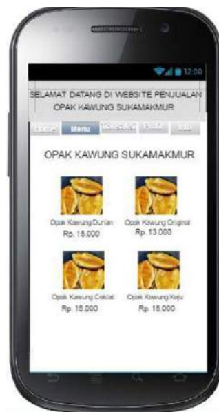
Gambar 7 Tampilan menu