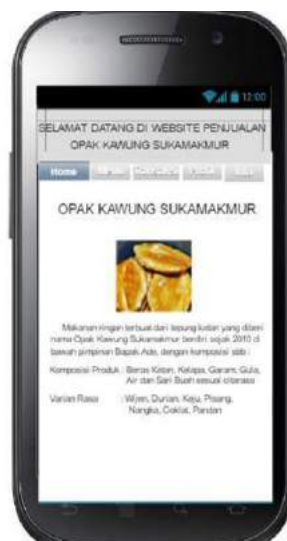
Gambar 6 Halaman Home