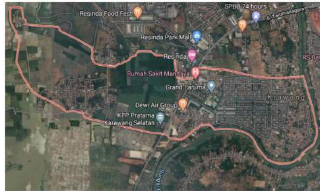
Gambar 1 Peta Desa Sukamakmur

memiliki jumlah penduduk yang dimiliki sekitar 7.250 jiwa, dimana total penduduk laki-laki 3.556 jiwa dan penduduk perempuan 3.694 jiwa.