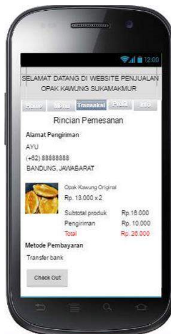
Gambar 8 Tampilan transaksi