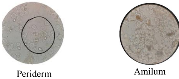
Gambar 1. Fragmen dan Identifikasi Simplisia Rimpang Jahe Pembesaran 40x.

Penetapan kadar senyawa terlarut dalam pelarut air dan etanol ini bertujuan sebagai perkiraan banyaknya kandungan senyawa-senyawa aktif yang bersifat polar (larut dalam air) dan bersifat polar – non polar (larut dalam etanol) (Utami et al. , 2017). Pada simplisia, kadar senyawa yang larut dalam pelarut air dan etanol adalah masing-masing sebesar 16,86 \pm 0,45\% dan 6,81 \pm 0,23\% . Kadar senyawa pada