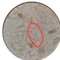
Berkas Pengangkut Tipe Tangga