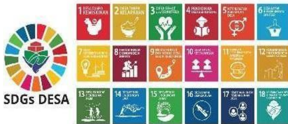
Gambar 1. SDGs Desa

dilaksanakan oleh perguruan tinggi dalam upayanya meningkatkan isi dan bobot pendidikan bagi mahasiswa untuk mendapatkan nilai tambah pendidikan tinggi. KKN dilaksanakan guna meningkatkan relevansi pendidikan tinggi dengan kebutuhan masyarakat, dengan tujuan memberi pendidikan pelengkap bagi mahasiswa sekaligus membantu masyarakat melancarkan pembangunan di lokasi KKN dilaksanakan. Di Desa Ridogalih yang bertempat di kecamatan Cibusah Kabupaten Bekasi terdapat tempat wisata yang cukup menarik untuk dikunjungi yaitu Taman Wisata Ridogalih Asri, namun akses untuk masyarakat luar kota bila ingin berkunjung kurang memadai terutama karna tidak adanya informasi dan arah jalan terkait tempat wisata itu maka dari itu sebagai mahasiswa yang sedang melaksanakan program KKN saya merasa ingin membantu warga desa agar banyak orang luar yang akan datang ke Desa Ridogalih dengan cara mempromosikan tempat wisata tersebut menggunakan pencantuman nama tempat wisata tersebut ke dalam google maps. Selain tempat wisata saya juga melihat potensi UMKM yang dapat bertumbuh di desa tersebut namun kurang nya media promosi menjadikan UMKM tersebut hanya berjualan untuk warga sekitar saja, salah satu UMKM tersebut ialah Pisang Keju Khasanah kami telah mencoba dan merasakan pisang keju tersebut dan kami berkesimpulan bahwasanya UMKM ini patut untuk dikembangkan salah satu cara kami untuk mengembangkannya yaitu dengan pencantuman nama usaha tersebut ke dalam google maps.