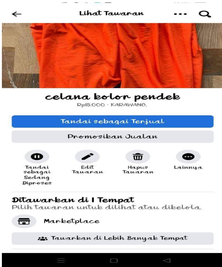
Gambar 1. Promosi di Marketplace Facebook

Setelah diberikan pelatihan pemilik dan karyawan konveksi sudah mulai mampu mengoperasikan sosial media facebook dan instagram dan dapat mempromosikan produknya sendiri secara bertahap dan baik. Berikut pada gambar 2 merupakan contoh promosi produk yang telah mereka unggah di Inatagram