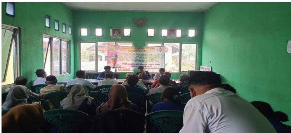
Gambar 1. Memberikan pelatihan tentang digitalisasi kepada Pelaku UMKM

Kegiatan pengabdian masyarakat yang bertujuan untuk mewujudkan penerapan sistem digitalisasi pada UMKM yang berada di Desa Telukbango dilakukan melalui sebuah pelatihan dan pendampingan secara offline.