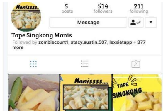
Gambar 2: Contoh Hasil Instagram Peserta Yang Sudah Beralih Ke Dalam Akun Bisnis