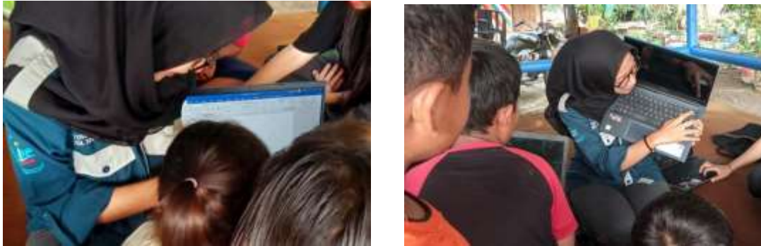
Gambar 1. Mahasiswa sedang menjelaskan tentang teknologi komputer

komputer yang telah diberikan ini akan membuahkan hasil bagi anak-anak di Dusun Telukmungkal Kelurahan Tanjungmekar baik pada saat ini maupun di masa yang akan datang. Berikut adalah dokumentasi kegiatan Sosialisasi Pengenalan Teknologi Komputer pada Anak di Dusun Telukmungkal Kelurahan Tanjungmekar pada 26 Juli 2023.