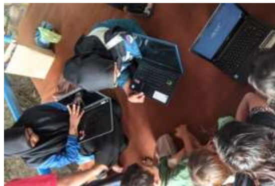
Gambar 2. Mahasiswa sedang mengajarkan secara langsung kepada anak-anak seperti apa itu teknologi komputer.