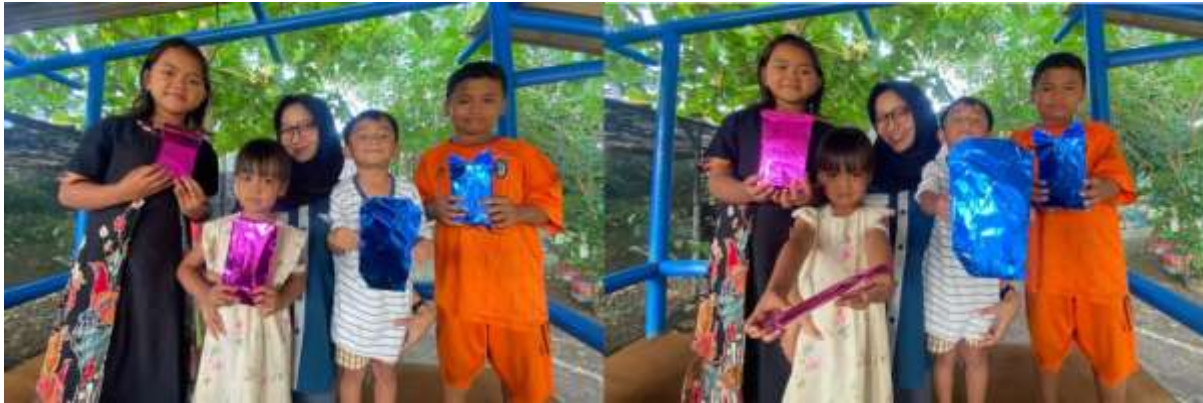
Gambar 4. Pembagian hadiah kuis