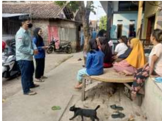
Gambar Sosialisasi Kesetaraan gender pada lingkungan keluarga.

anak yang akan menjadikan kebaikan dalam rumah tangganya.