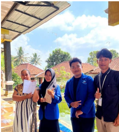
Gambar 3. Grafik perkembangan pencatatan UMKM di Desa Nagrog

Gambar di atas merupakan pembagian buku pencatatan penjualan kepada pelaku UMKM. Buku tersebut adalah buku yang akan di gunakan pelaku UMKM untuk pencatatan penjualan agar UMKM beralih kepada pencatatan baru yang telah kami sosialisasikan kepada setiap pelaku UMKM di Desa Nagrog. Buku tersebut telah kami berika ke sebagian besar pelaku UMKM di Desa Nagrog tersebut, dan kami telah berhasil melakukan sosialisasi dan membagikan buku-buku tersebut dan sebagian besar pelaku UMKM disana telah menggunakan pencatatan penjualan tersebut.