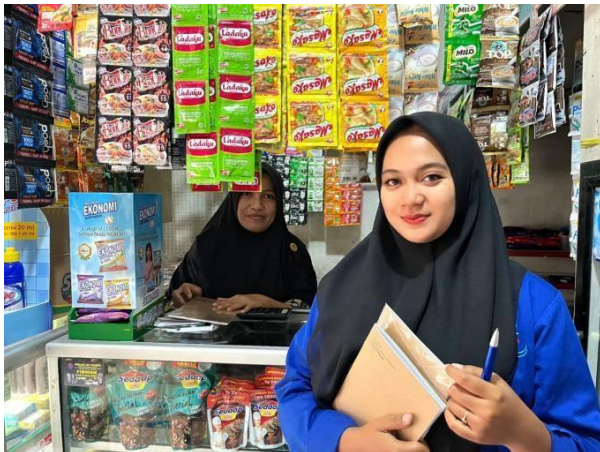
Gambar 1. Pemberian buku pencatatan keuangan sederhana kepada UMKM

Dari hasil pengabdian masyarakat ini, dapat diketahui materi yang telah disampaikan dimengerti dan bermanfaat bagi warga dan khususnya UMKM di Desa Nagrog melalui pelatihan pembukuan sederhana, sehingga dapat diketahui kegiatan ini dapat meningkatkan pengetahuan, wawasan, pengalaman dan motivasi para pelaku usaha yang inovatif, kreatif dan mandiri. Setelah sosialisasi selesai maka saya memberikan pertanyaan kepada UMKM tentang bagaimana UMKM paham akan apa yang saya jelaskan mengenai pencatatan penjualan atau pembukuan akuntansi, yang bertujuan untuk memastikan bahwa pelaku UMKM memahami apa yang saya sampaikan, dengan memberikan pertanyaan hasilnya adalah Pelaku UMKM sudah memahami mengenai penjelasan yang saya sampaikan. Dengan adanya kegiatan pengabdian masyarakat ini memberikan ilmu pengetahuan yang baru dalam mengembangkan laporan penyusunan pembukuan sederhana.