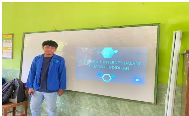
Gambar 1 Sosialisasi tentang pengaruh internet terhadap Pendidikan

Karena itu penulis memberi beberapa saran seperti aplikasi atau web untuk membuat materi pelajaran lebih menarik untuk dipelajari oleh siswa itu sendiri seperti contohnya yaitu Book Creator. Book Creator sendiri adalah tool sederhana untuk pembuatan buku yang atraktif, karena tool tersebut bukan hanya menampilkan tulisan atau gambar saja. Tetapi, juga dapat menyisipkan suara dan video.