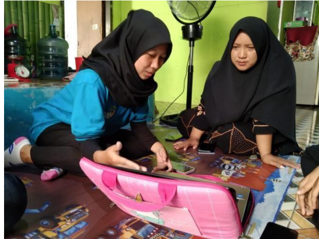
Gambar 1 Sosialisasi Mengenai Aplikasi Buku Kas

UMKM Keripik Tempe Rinjani belum mampu mengelola aplikasi Buku Kas secara mandiri. Dengan adanya pengabdian ini dapat memberikan arahan dan langkah-langkah dalam menggunakan aplikasi tersebut secara perlahan. Melalui kegiatan pengabdian kepada masyarakat ini diharapkan UMKM Keripik Tempe Rinjani dapat membuat pencatatan keuangan dengan rapi dan lebih praktis dengan memanfaatkan teknologi saat ini.