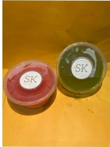
Gambar 2. Tampilan tentang Produk UMKM

Jelly Rumput laut merupakan jelly yang dibuat dari ekstraksi satu jenis rumput laut dan campuran berbagai macam rumput laut lainnya. Hasil jelly dari campuran ini dinilai cukup bermutu dan berkualitas. Tidak kalah dengan jelly lainnya yang dihasilkan dari satu jenis bahan. Jelly Rumput Laut ini mempunyai beberapa varian warna yaitu ada warna hijau, merah, kuning, hitam, ping, biru, oren, dan putih. Komposisinya : Jelly Powder, Air, dan Pewarna Makanan.