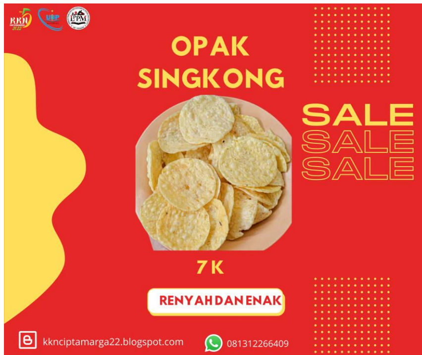
Gambar 2. Flayer Promosi

Gambar di atas merupakan tampilan Flayer Promosi UMKM Ciptamarga, flayer tersebut nantinya akan dibagikan ke social media seperti facebook atau Instagram.