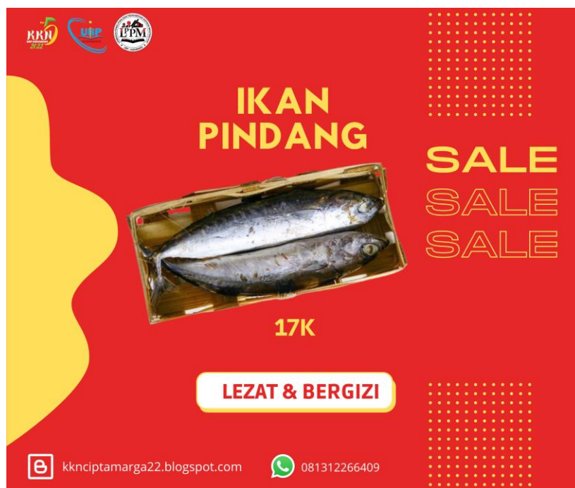
Gambar 1. Flayer Promosi

Kegiatan Kuliah Kerja Nyata yang dilakukan oleh Mahasiswa dan Mahasiswi Universitas Buana Perjuangan Karawang memanfaatkan Blogspot dan juga social media untuk memperkenalkan dan pemasaran UMKM pada era digitalisasi. Dengan tujuan mengembangkan dan memperluas jangkauan pemasaran produk UMKM mereka sendiri. Dengan begitu, dapat membantu meningkatkan kreativitas dalam memperkenalkan dan memasarkan produk UMKM. Dengan begitu, dapat membantu meningkatkan kreativitas dalam memperkenalkan dan memasarkan produk UMKM, sehingga pemasaran dapat menyebar luas ke pasar yang lebih luas. Serta meningkatkan pelaku UMKM dalam penggunaan digitalisasi untuk memperkenalkan dan pemasaran produk. Adapun tampilan flayer produk untuk memperkenalkan UMKM desa Ciptamarga dapat di lihat pada gambar di bawah ini :