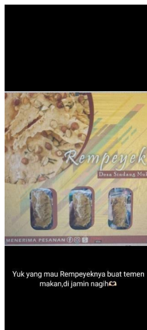
Gambar 1.7 Promosi Rempeyek di media sosial yaitu Whatsapp