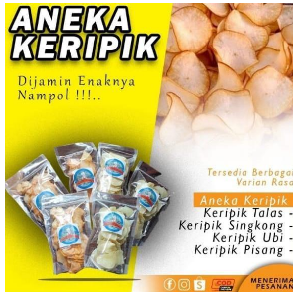
Gambar 1.4 Inovasi Pembuatan Pamflet Promosi UMKM Makring