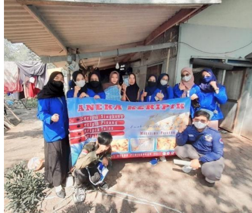
Gambar 1.2 Inovasi Kemasan, Logo dan Banner UMKM Makring