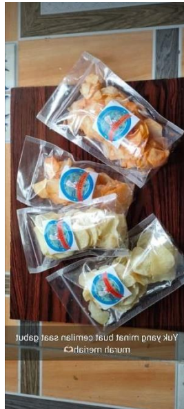
Gambar 1.3 Promosi Makring di Media Sosial yaitu whatsapp