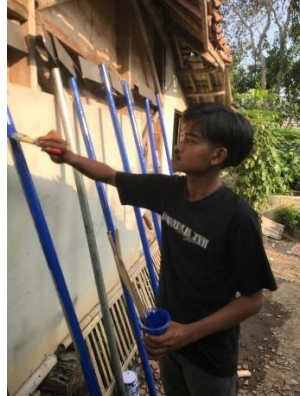
Gambar 1. 5 Pengecatan nama gang