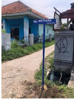
Gambar 1. 4 Pemasangan Gang Mutiara