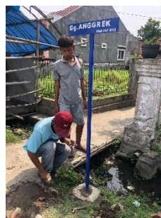
Gambar 1. 3 Pemasangan Gang anggrek

Proses pengerjaan pembuatan plang penunjuk dusun tersebut membutuhkan waktu 3 hari, yaitu mulai dari 25 sampai dengan 27 Juli 2022, jangka waktu ini sudah sesuai dengan jadwal yang sudah tim kuliah kerja nyata tentukan. Langkah selanjutnya yaitu kegiatan pemasangan plang penunjuk dusun pada titik lokasi yang sudah ditentukan. Kegiatan ini dilakukan dibantu oleh masing-masing kepala dusun dan warga sekitar.