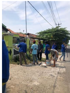
Gambar 1. 7 Pemasangan Gang Tulip