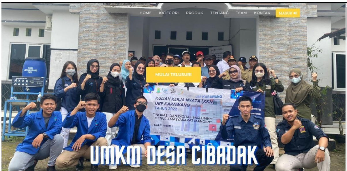
Gambar 1 Tampilan Dashboard

kondisi terdampak pandemic covid-19. Website ini dibuat dengan tampilan yang dapat memudahkan pengguna dan memudahkan para pemilik UMKM dalam mempromosikan dan memasarkan produknya kepada masyarakat dengan memanfaatkan teknologi yang ada. Pada website ini pengguna dapat memasarkan produknya dengan membuat akun terlebih dahulu setelah itu pengguna dapat mengisi data-data terkait produk yang ingin dipasarkan. Setelah mengisi data-data tersebut produk UMKM akan muncul pada halaman produk UMKM, lalu setelah itu pengguna hanya tinggal menunggu pemesanan dari pembeli. Jika pelanggan tertarik pada produk tersebut maka pelanggan dapat memesan dengan menghubungi penjual produk UMKM tersebut. Adapun tampilan website UMKM Desa Cibadak sebagai berikut.