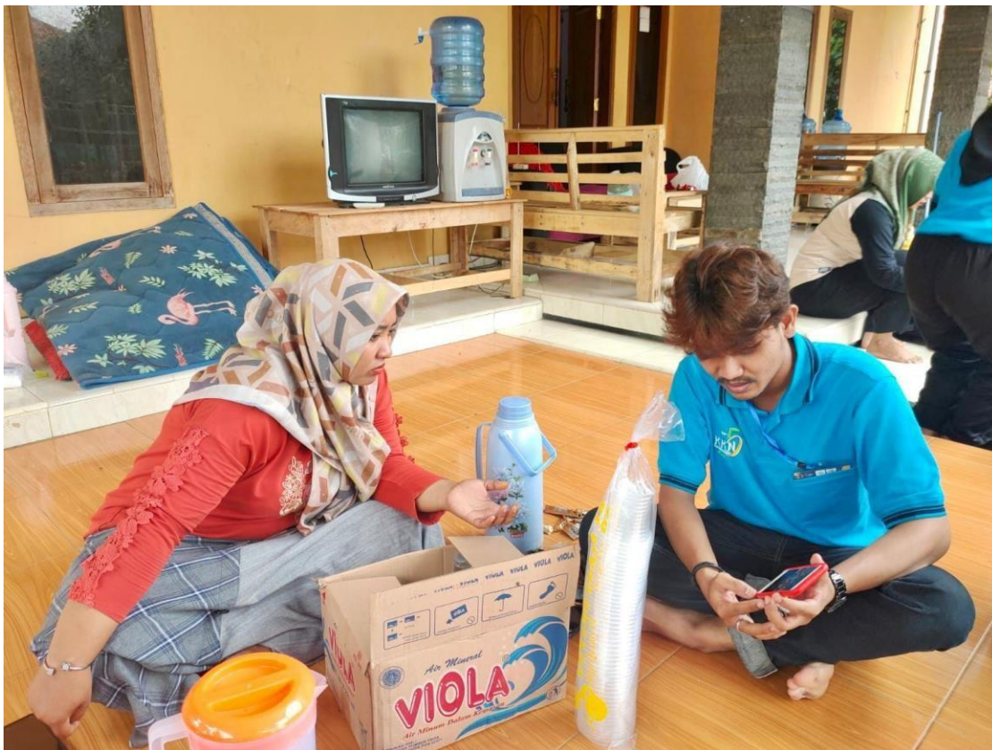
Gambar 1. Penjelasan dan pelatihan aplikasi instagram

pendekatan dilakukan dengan memberikan sosialisasi kepada Ibu PKK mengenai sosial media seperti instagram dan facebook. Kegiatan sosialisasi dilakukan secara langsung dengan memberikan penjelasan kepada Ibu PKK dan melakukan diskusi tanya jawab. Dan menggunakan metode pelatihan dalam cara mempromosikan wajit mangga dan sirup mangga. Pelatihan ini memiliki tujuan untuk memperoleh penambahan pengetahuan, ataupun sebuah keterampilan untuk membangun dan mengembangkan seorang individu ataupun kelompok untuk mencapai sebuah tingkat kemahiran dan kemampuan yang diinginkan