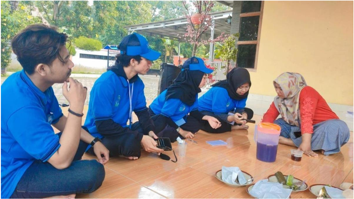
Gambar 1. Penjelasan dan Pelatihan Aplikasi BukuKas