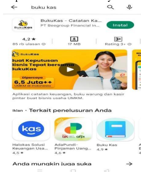
Gambar 2. Download dan Install Aplikasi BukuKa