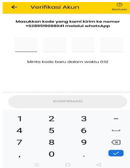
Gambar 3. Mendapatkan Kode OTP