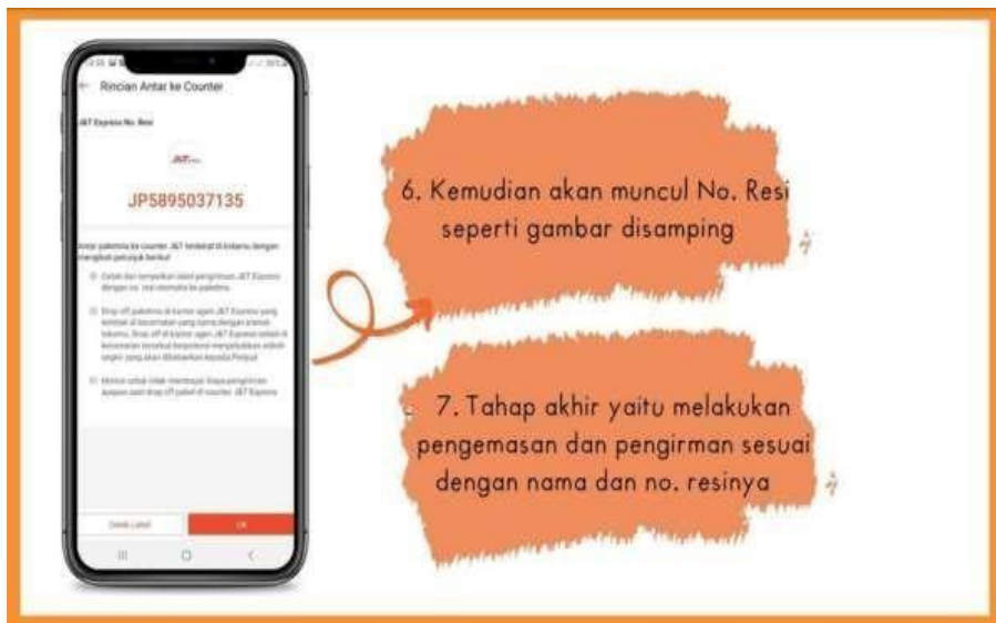
Gambar 5 Tampilan Rincian Antar ke Counter