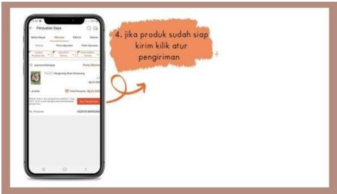
Gambar 3 Tampilan Penjualan Saya