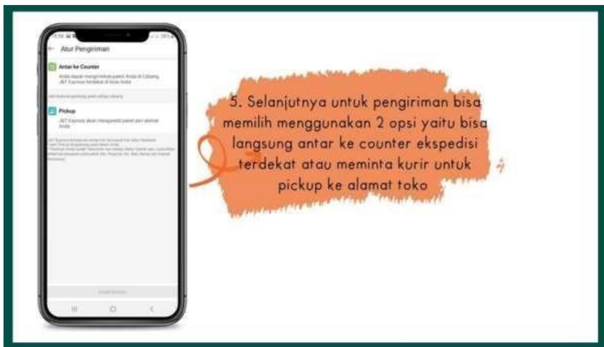
Gambar 4 Tampilan Atur Pengiriman