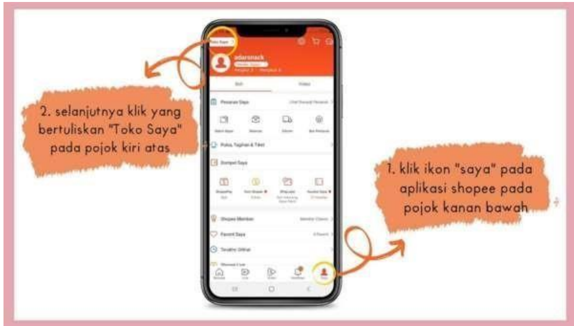
Gambar 1 Tampilan Toko Saya

satu e-commerce agar dapat memperluas penjualan dan meningkatkan penjualan produk tersebut.. Maka dari itu mahasiswa dari UBP Karawang membantu dalam pembuatan akun salah satu e-commerce tersebut dan berikut adalah tampilan akun Shopee :