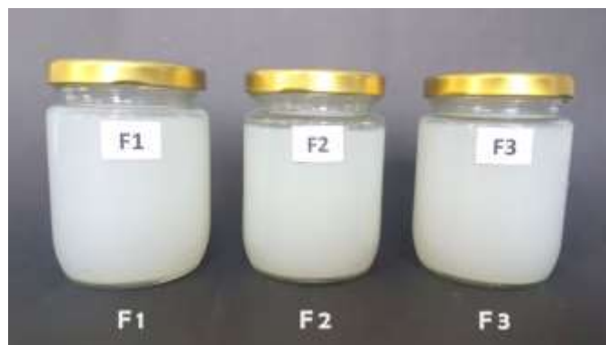
Gambar 1. Esensi sediaan ekstrak beras ketan putih

Sediaan esensi ekstrak beras ketan putih mengandung pH rata-rata untuk F1 adalah 4,92 \pm 0,01 ; F2 adalah 4,95 \pm 0,01 ; dan F3 adalah 4,97 \pm 0,02 atau dapat dilihat pada tabel 3 di atas. Nilai pH yang dihasilkan dari ketiga formula (F1, F2, dan F3) masih sesuai dengan rentang pH kulit yaitu 4,5 – 5,6 (Baki et al. , 2015) atau (Wasitaadmaja, 1997 dalam Zulkarnaen et al. , 2013) dan 4,5 - 6,5 (Rizky et al. , 2013 dalam Yumas, 2016, Tranggono dan Latifah, 2007).