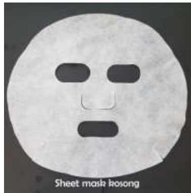
Gambar 3. Sheet mask kosong (masker lembaran)

Dari penilaian terhadap warna sediaan esensi ekstrak beras ketan putih dapat disimpulkan bahwa 12,5% responden sangat menyukai; 43,75% responden suka; dan sisanya 43,75% responden menilai netral terhadap warna sediaan. Berdasarkan hasil analisis terhadap warna esensi menggunakan rumus perhitungan SNI 01-2346-2006 diketahui bahwa interval nilai uji kesukaan warna esensi ekstrak beras ketan putih adalah 3,45-3,93. Untuk penulisan nilai akhir warna diambil nilai terkecil yaitu 3,45 dan dibulatkan menjadi 3,0. Berarti kesukaan rata-rata panelis terhadap warna esensi adalah netral atau biasa.