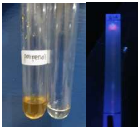
Gambar 2 Hasil uji fitokimia dan KLT (fraksi 1)

Dilakukan pengujian dengan sedikit mengambil ekstrak didalam vial (fraksi 1) dan diuji dengan pereagen fitokimia, tujuannya memperkirakan hasil yang didapat dalam suatu metabolit sekunder. Dilakukan dengan penambahan \text{FeCl}_3 5% menunjukkan warna orange yang termasuk kedalam polifenol.